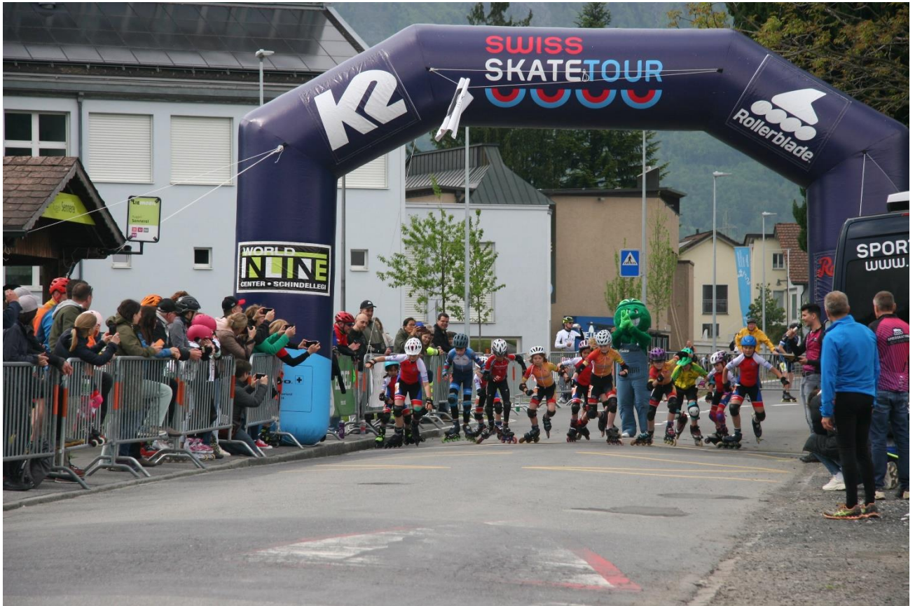
Abbildung 1: Inline Event Liechtenstein - Teilnehmerinnen und Teilnehmer im Nachwuchsbereich

Der Verein Speedskating Liechtenstein zieht eine positive Bilanz in einer Saison mit einigen Inlinerenen.