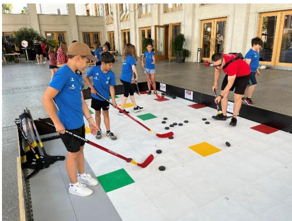
Foto: Olympic Day SchaanMauren

Jahresberichte der Vereine sind separat aufgeführt