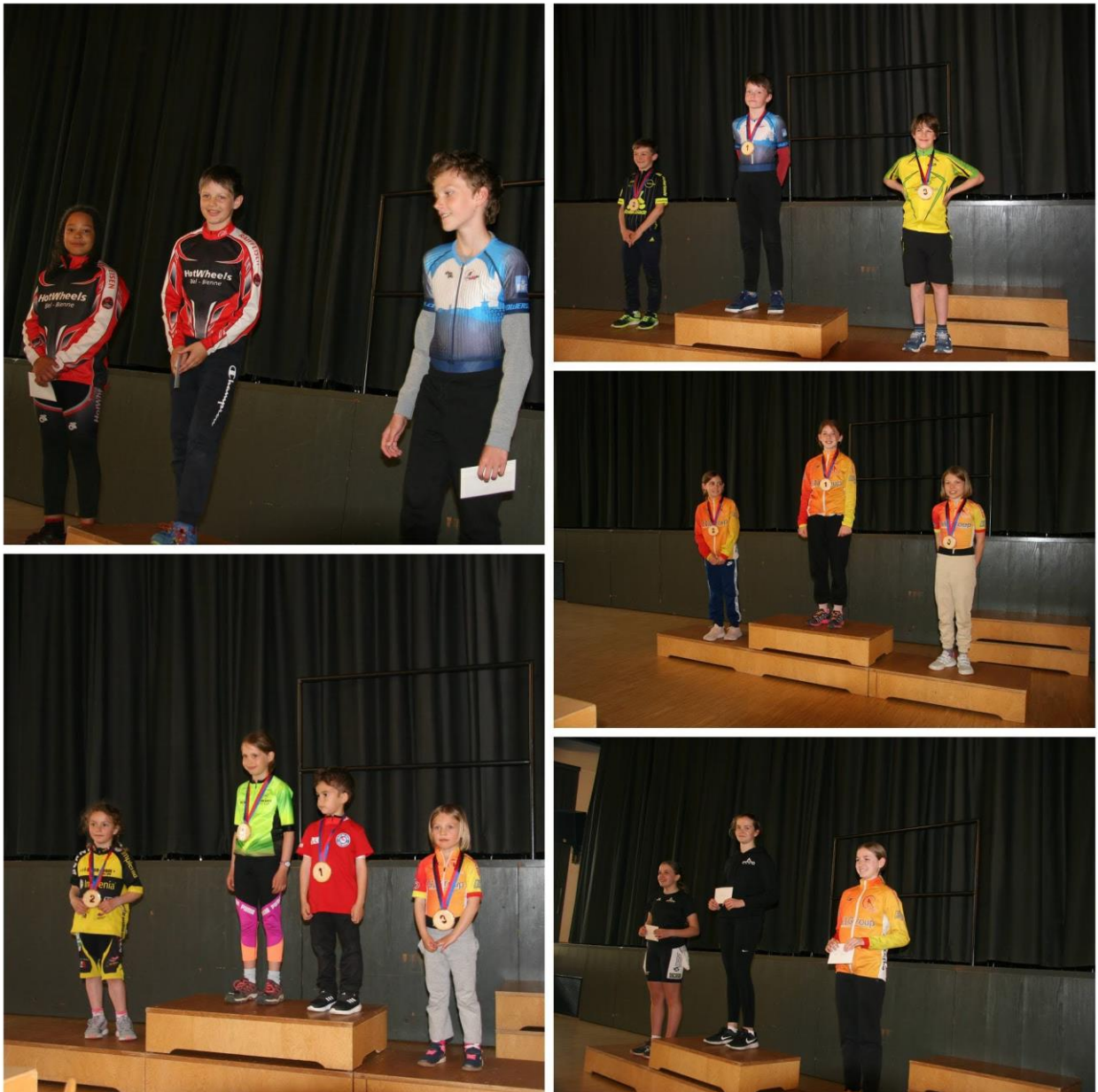
Abbildung 3: Siegerehrungen der Kategorien im Nachwuchsbereich