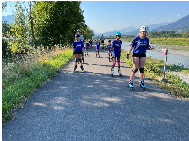
Foto: Sportwoche Ausfahrt zum Badensee Gamprin