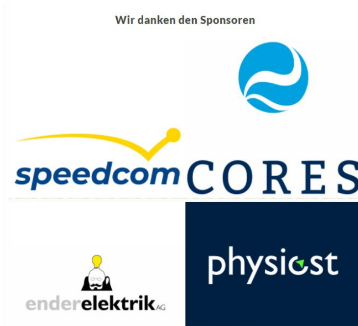
Abbildung 8: Sponsoren des Inline Event Liechtenstein

Die Durchführung war für uns nur möglich Dank der sehr guten Zusammenarbeit mit der Gemeinde Ruggell, der Landesverwaltung und der Regierung von Liechtenstein.