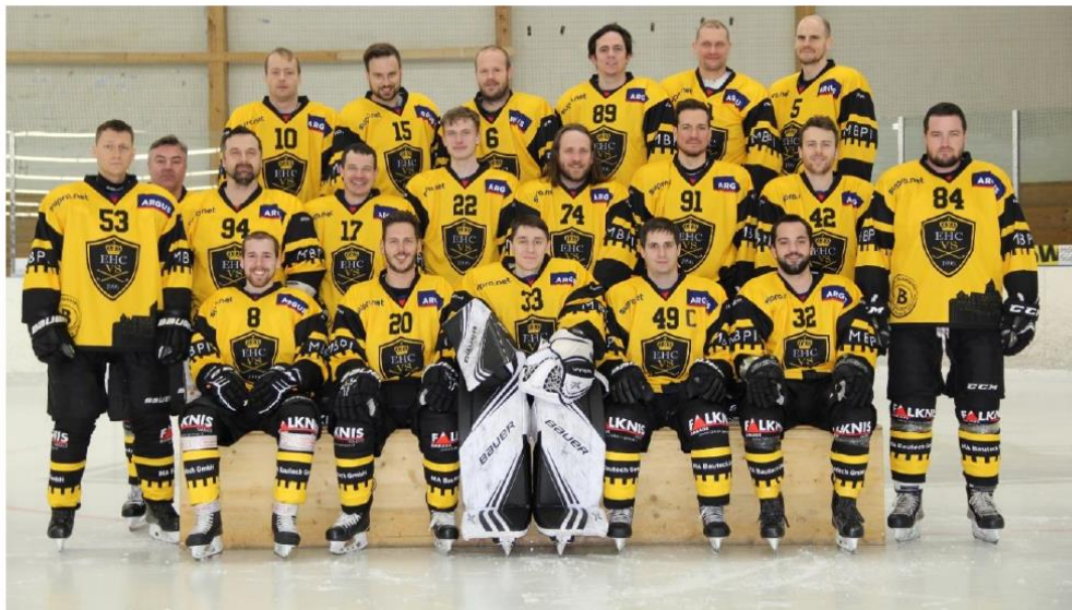
Der EHC Vaduz Schellenberg in den neuen Dressen.