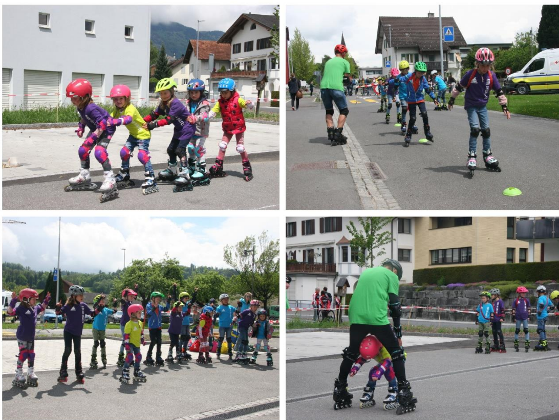
Abbildung 2: Kids on Skates

In 2023 hat sich die Nachwuchsarbeit auf die Durchführung des Kids on Skates Kurs und der verschiedenen Rennen anlässlich des Inline Event Liechtenstein begrenzt.