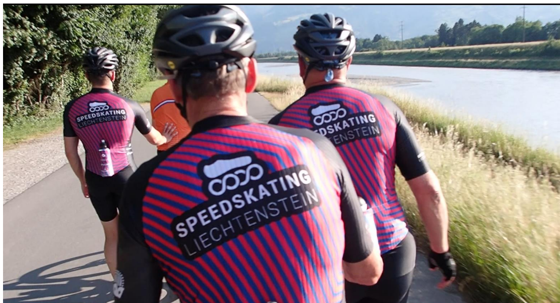
Abbildung 4: Training auf dem Rheindamm