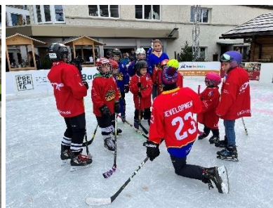
Kids on Ice Day