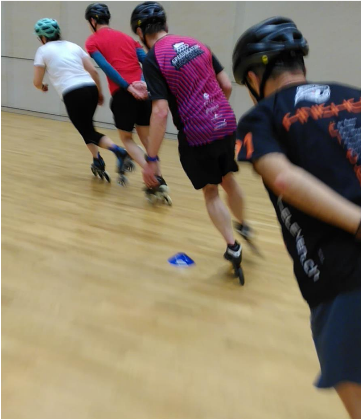
Abbildung 5: Training in der MZH Spoerry (Vaduz)